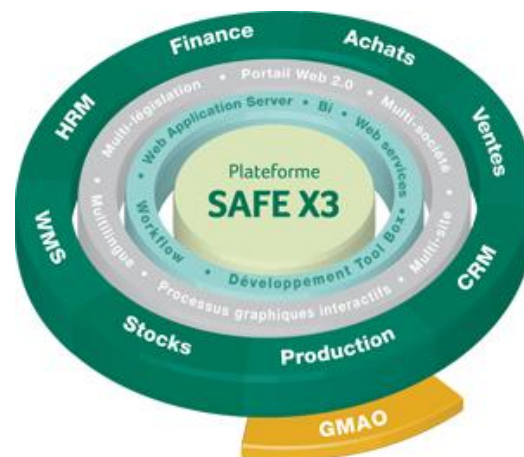
Solution GMAO pour Sage ERP X3

L'offre intégrée GMAO DIMO Maint - Sage ERP X3 grâce à un connecteur unique répond complètement aux besoins des entreprises en termes d'optimisation et de rationalisation des processus de maintenance. La gamme de logiciels pour la maintenance DIMO Maint apporte une réponse métier élargie face aux contraintes budgétaires, technologiques et fonctionnelles des sociétés de toutes tailles et de tous secteurs d'activité.